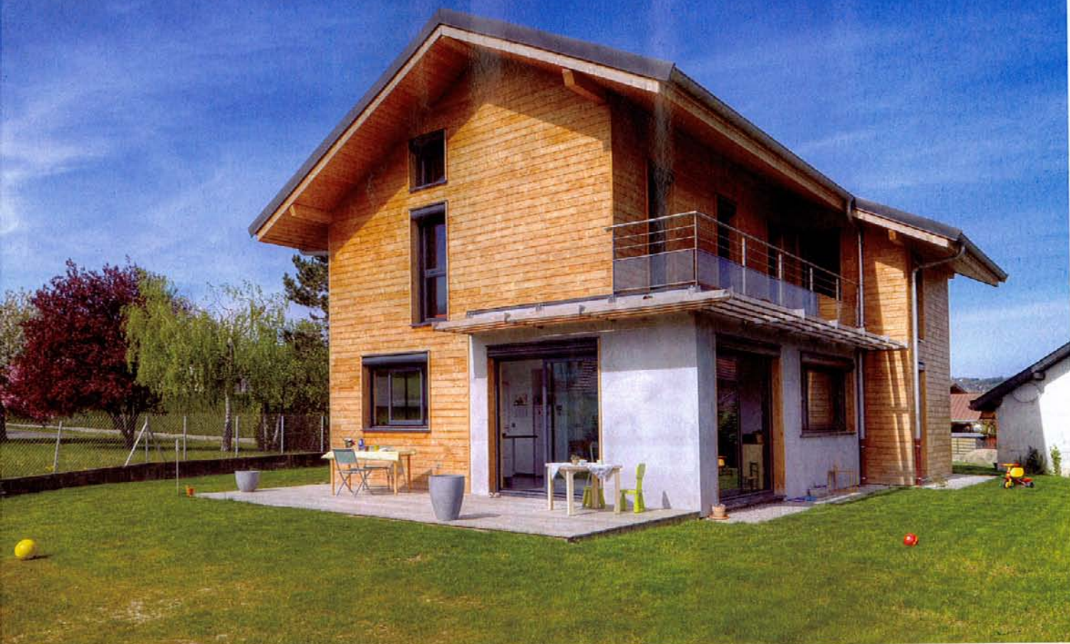
Compacte et orientée de façon à profiter au maximum des apports solaires, la maison répond à des critères bioclimatiques.