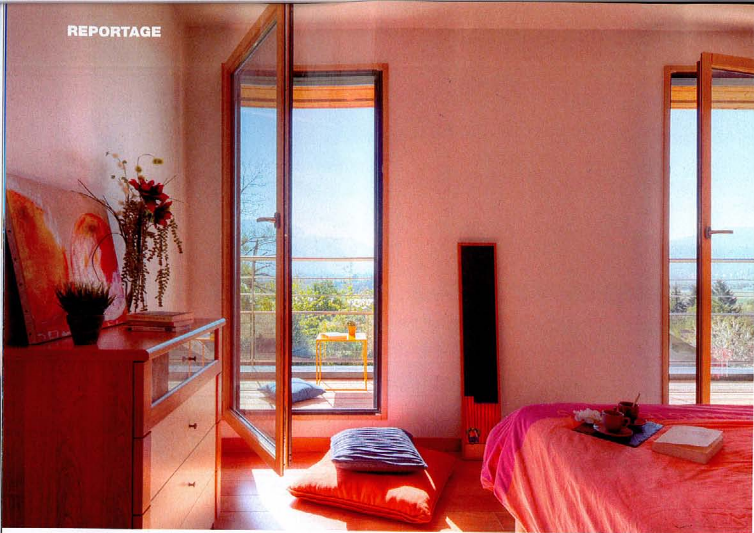
Depuis la chambre parentale, on accède au balcon qui surplombe le salon et sur lequel s'ouvrent également deux autres chambres.