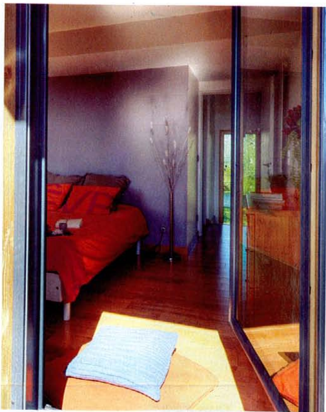
Dans les chambres à l'étage, les propriétaires ont opté pour des sols stratifiés haut de gamme.

★ RETROUVEZ LES PLANS DE CETTE MAISON DANS LE CAHIER DE PLANS PAGE 116