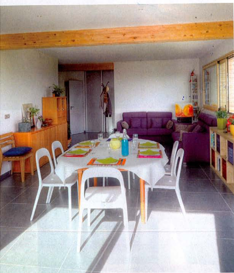
Le carrelage du rez-de-chaussée recouvre un plancher-chauffant alimenté par la chaudière à condensation au gaz.